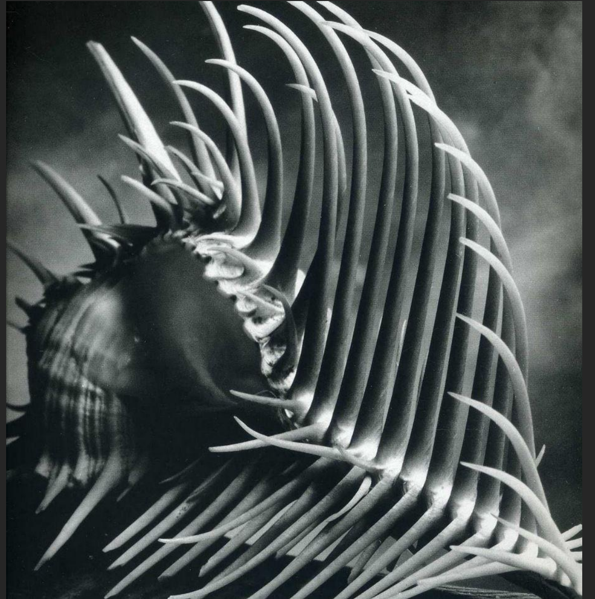
Due conchiglie con il cielo e una conchiglia venus comb.