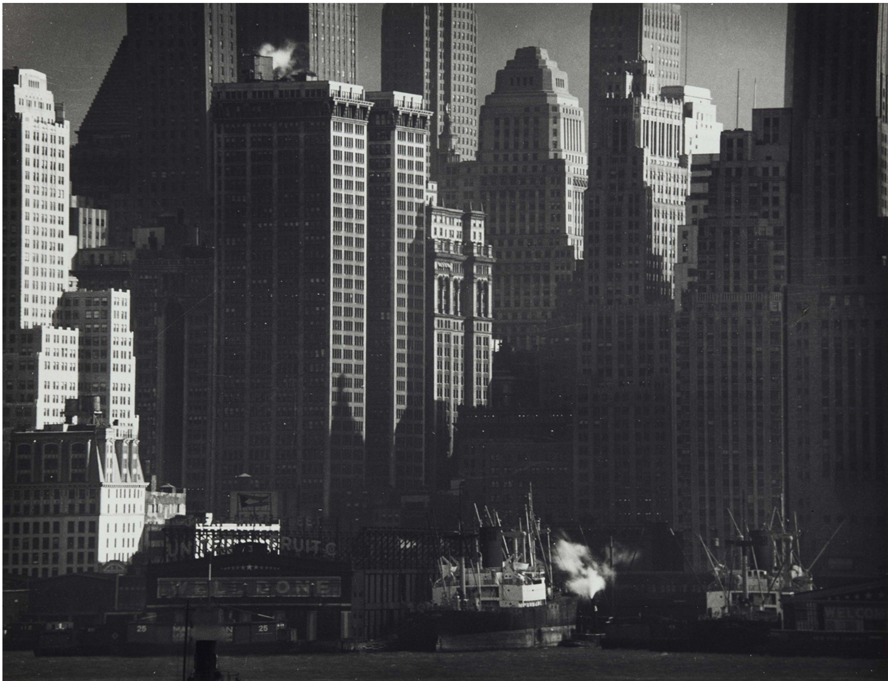
Monumenti di New York.