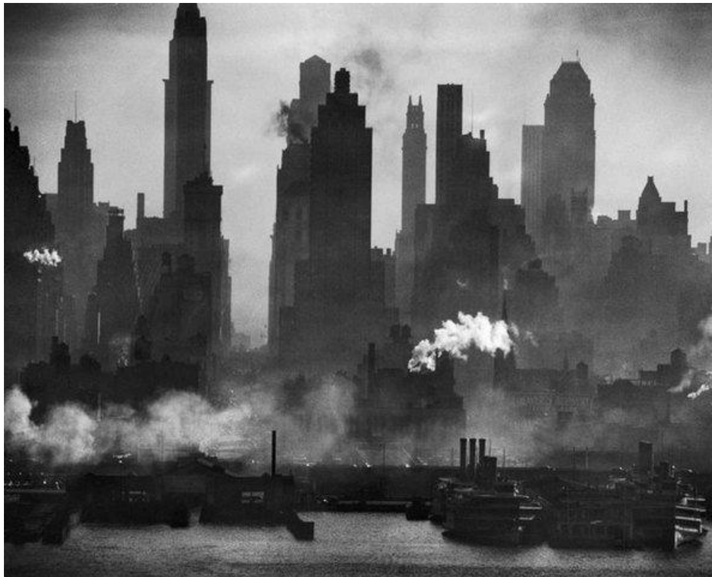
Edifici di New York.