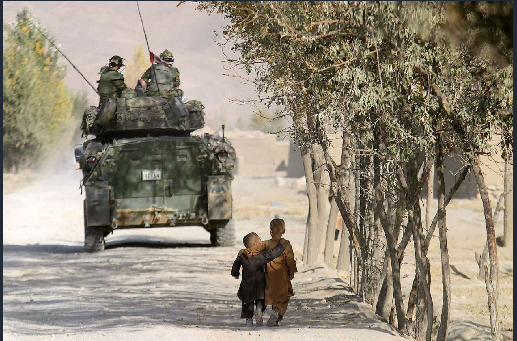
Bambini afgani camminano a braccetto mentre le forze armate pattugliano una scuola a Karez-i-Murra, Afghanistan. 2003

«È stato un periodo molto ottimista e un privilegio poter documentare la vita in Afghanistan in quel momento. La gente era incredibilmente ottimista. Trovavi gente che ballava per le strade.»