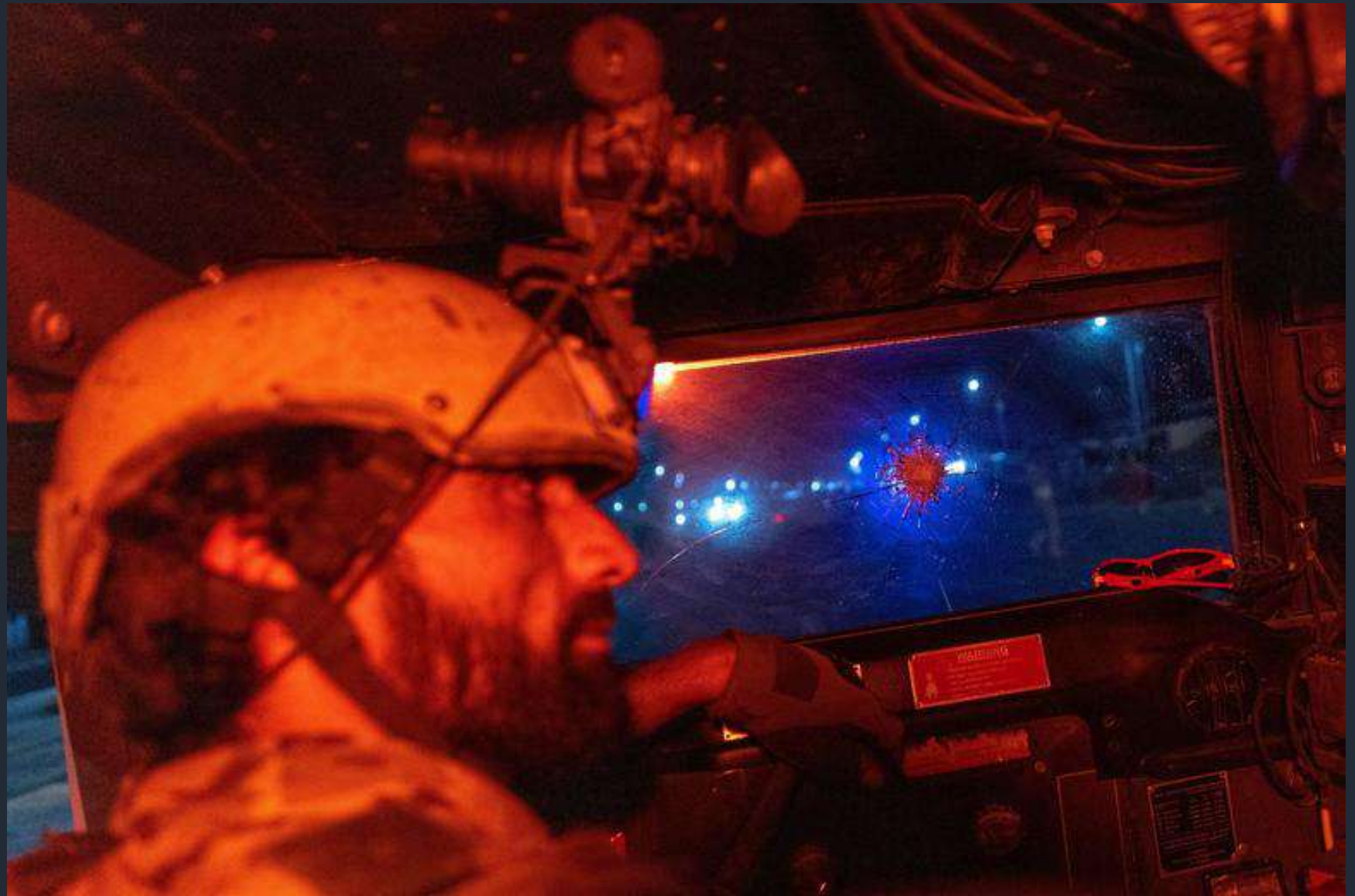
Membro forze speciali afgane, Kandahar, Afghanistan. 11 Luglio 2021

«Scatto per l'uomo comune che vuole vedere e sentire una storia da un luogo in cui non può essere presente in prima persona.»