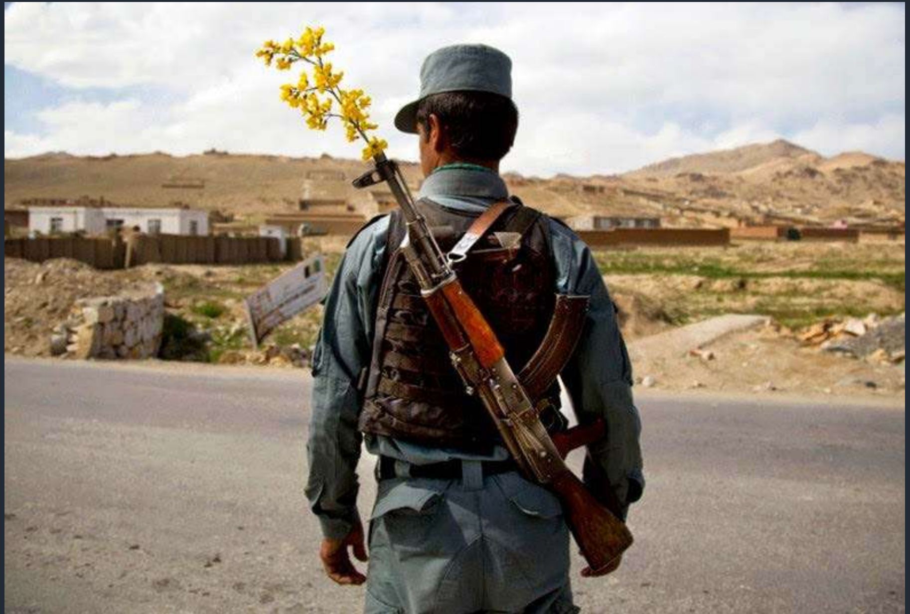
Un ufficiale di polizia nazionale afghana a un posto di blocco alla periferia di Maidan Shahr, Afghanistan. 15 Maggio 2013