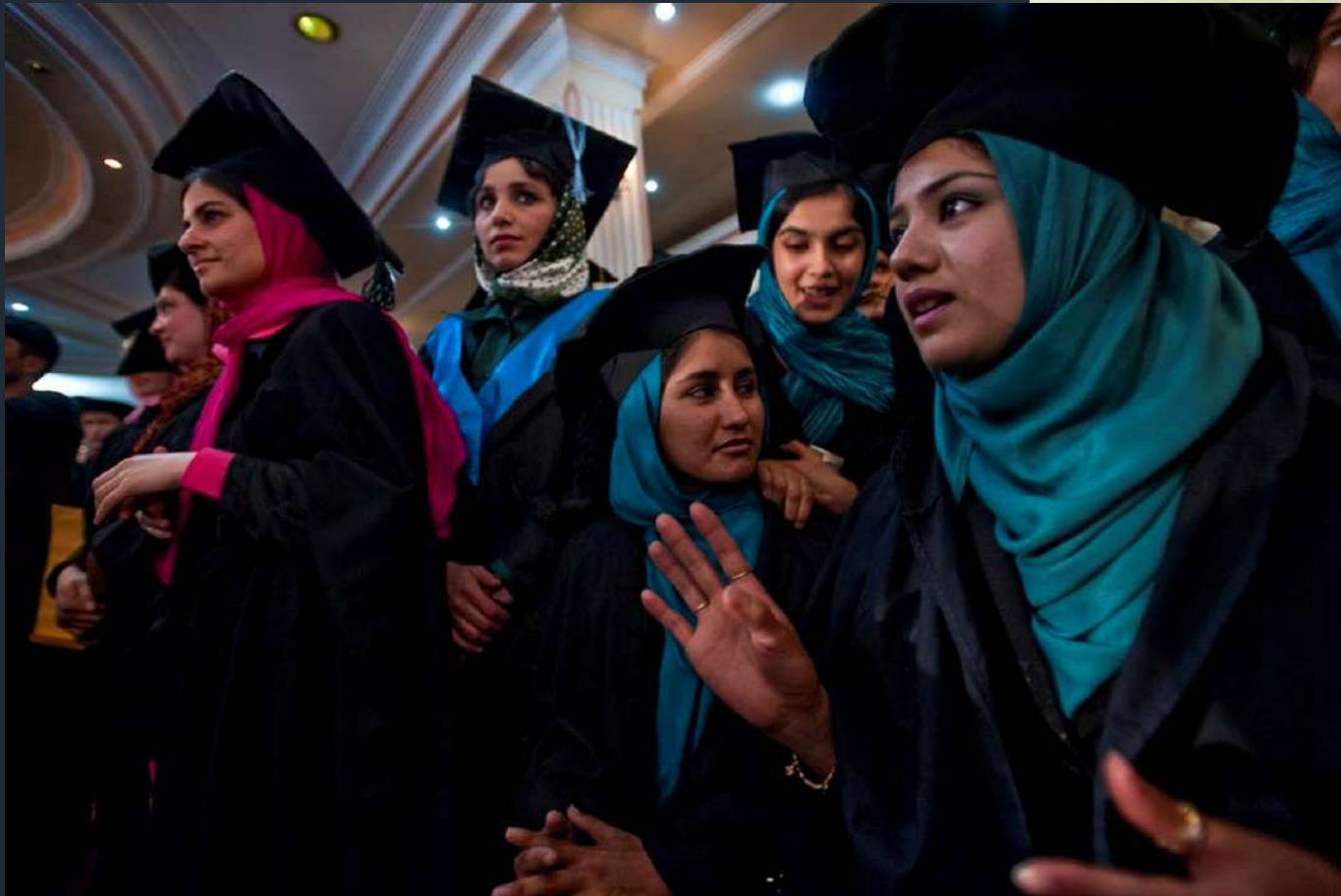
Classe 2010 dell'Università di Kabul, Kabul, Afghanistan. 2010