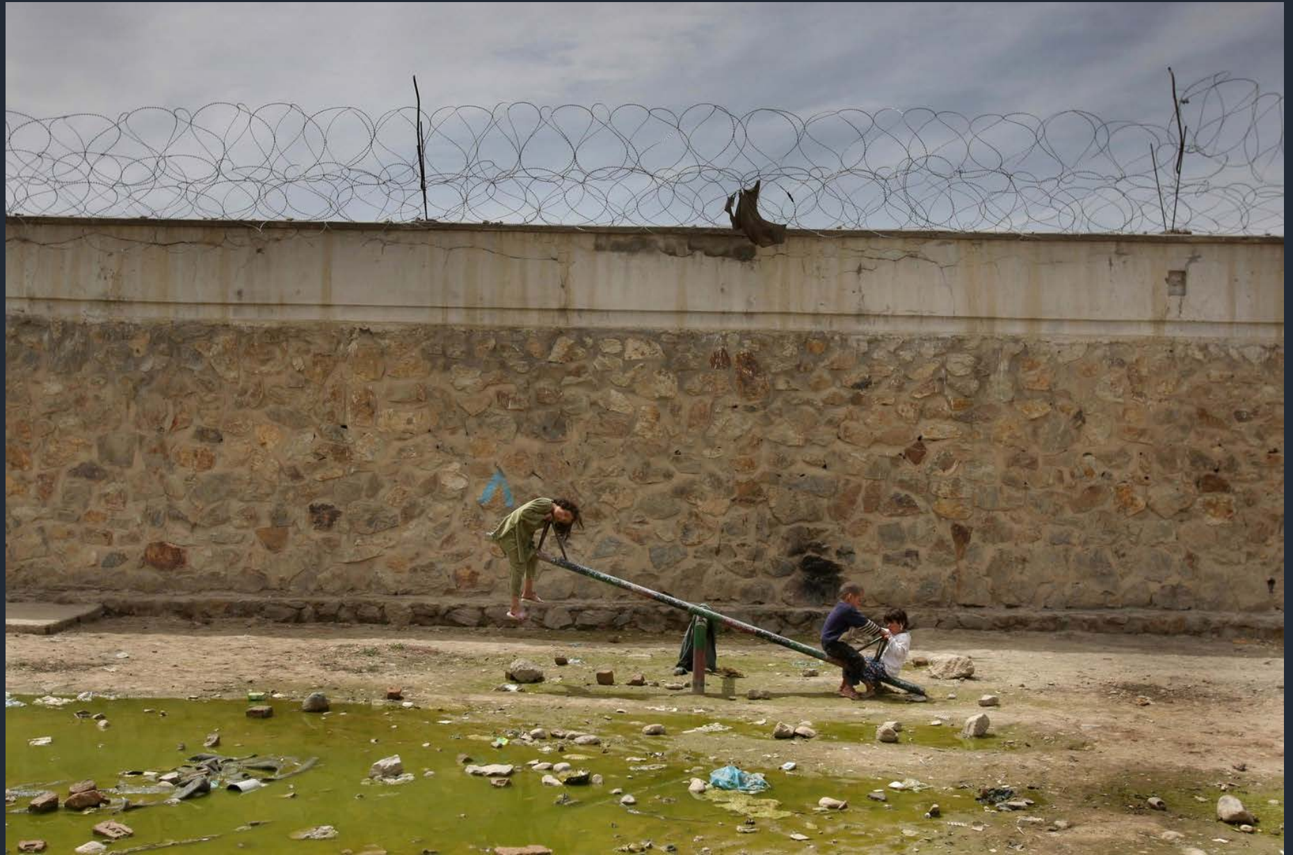
Prigione Pul-e Charkhi, Kabul, Afghanistan. Aprile 2008