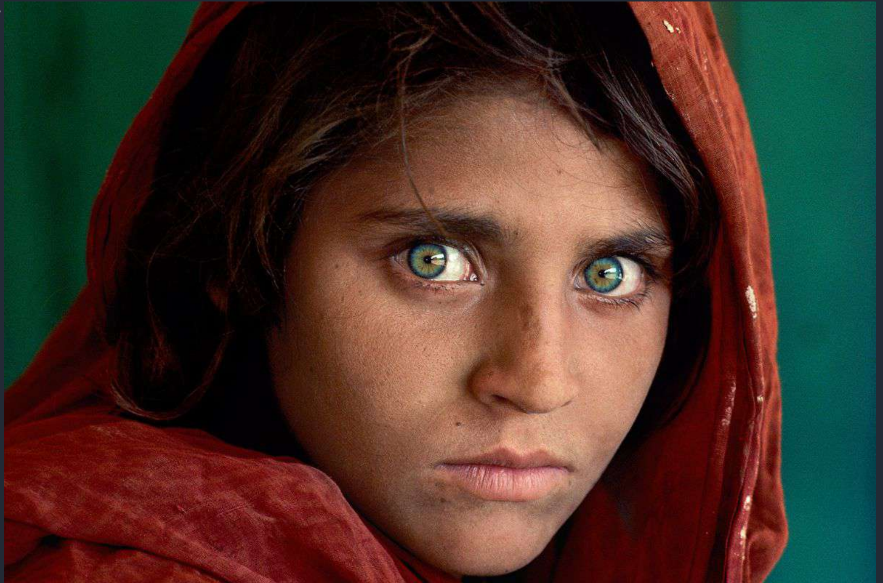
La ragazza afghana (Sharbat Gula), Peshawar, Pakistan. 1984

« Sono sempre stato convinto che fossero i soggetti più deboli dell'umanità a poter raccontare grandi storie su quanto accade nel mondo. Non penso che il mio lavoro possa rappresentare un reale cambiamento per queste persone, ma può essere un modo per aiutarle, per portare a conoscenza di tutti le loro storie. Un bel ritratto svela sempre qualcosa di importante di una persona. »