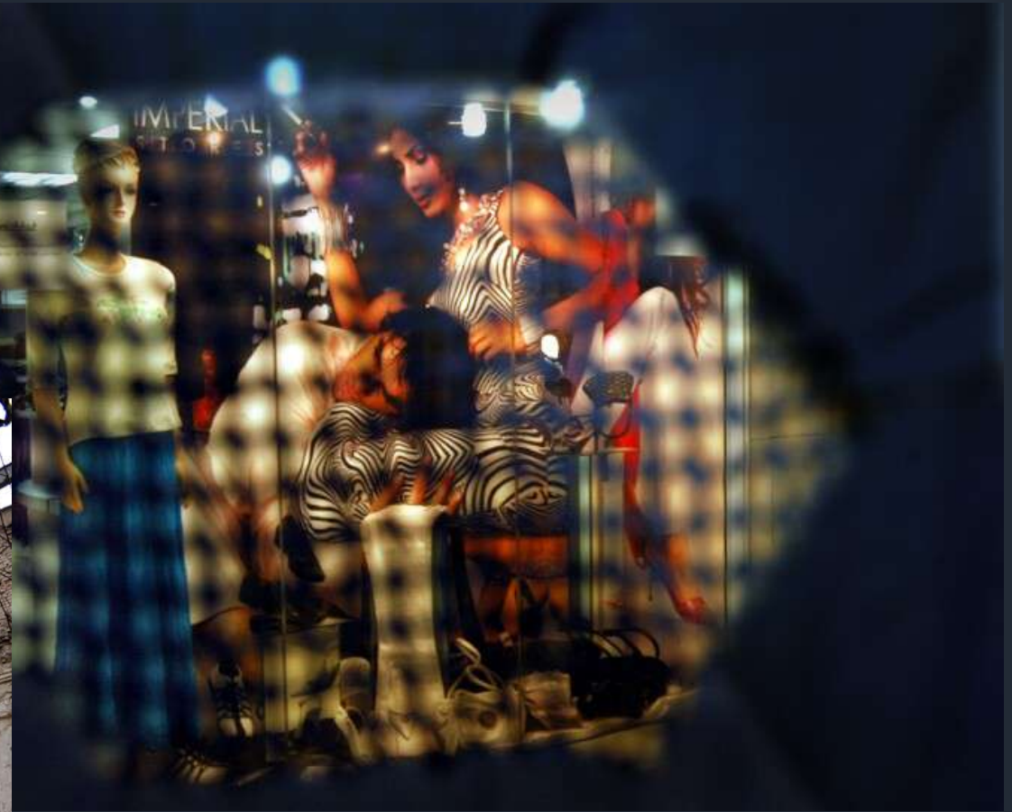
Vista da dietro un burqa, Kabul, Afghanistan. 2007