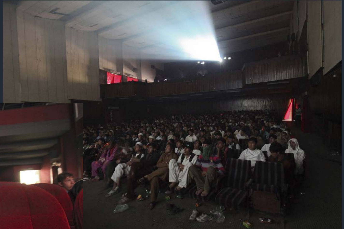
Cinema Pameer. Kabul, Afghanistan. Agosto 2013