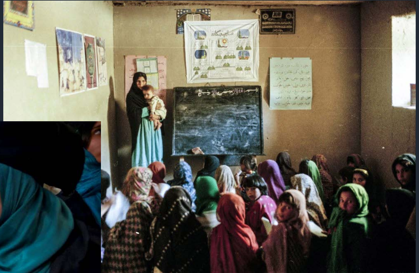
Una scuola segreta femminile sotto i talebani nella provincia di Logar, Afghanistan. Maggio 2000

Sotto i talebani, l'istruzione per le ragazze e le donne era vietata.