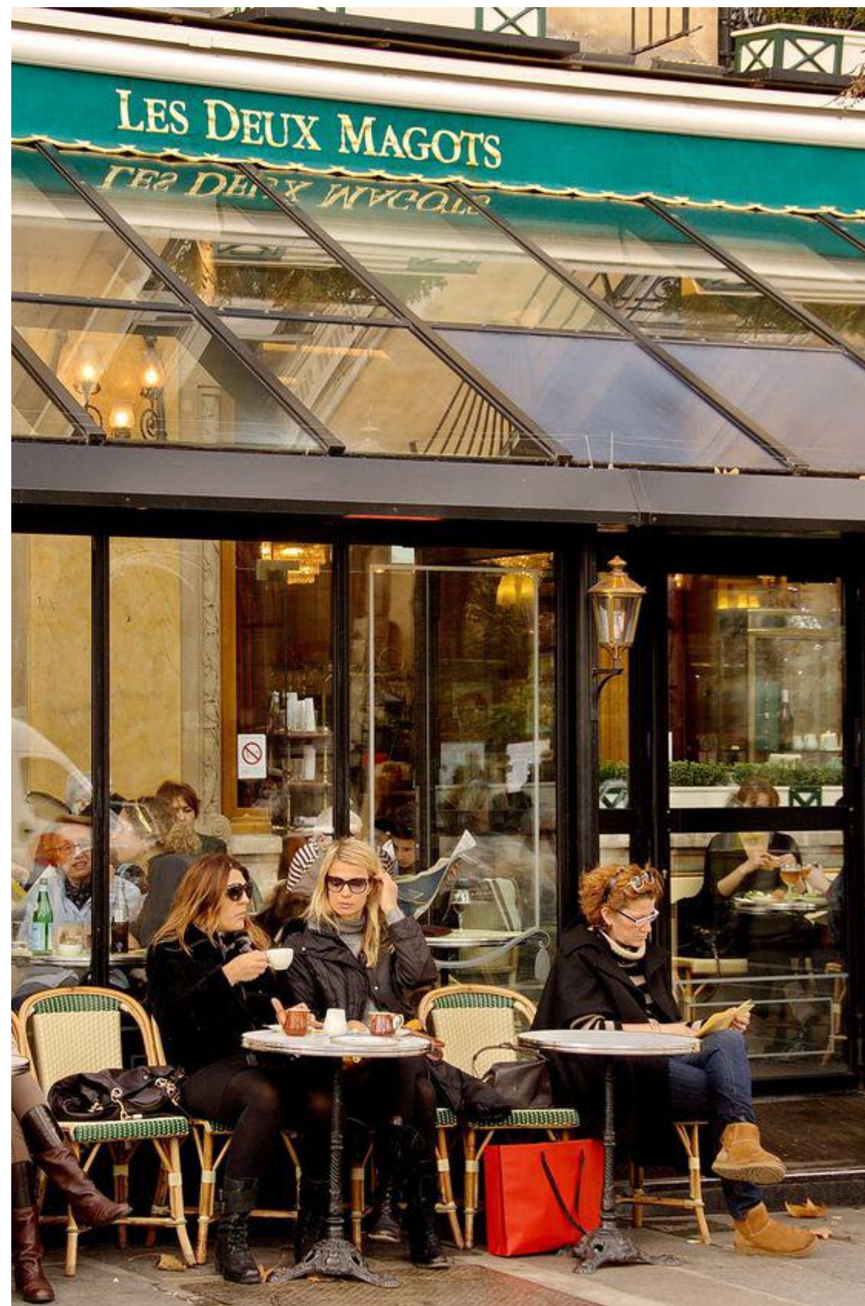
(Fotografia di Massimo Ferracini, 2012)

L'"Art de vivre" incarna lo stile francese ed in particolare quello parigino. Cibo, tradizioni, cultura, amicizia, prendersi il tempo per condividere, parlare, vivere, godersi le cose semplici rappresenta il cuore pulsante di Parigi, il suo stile di vita.