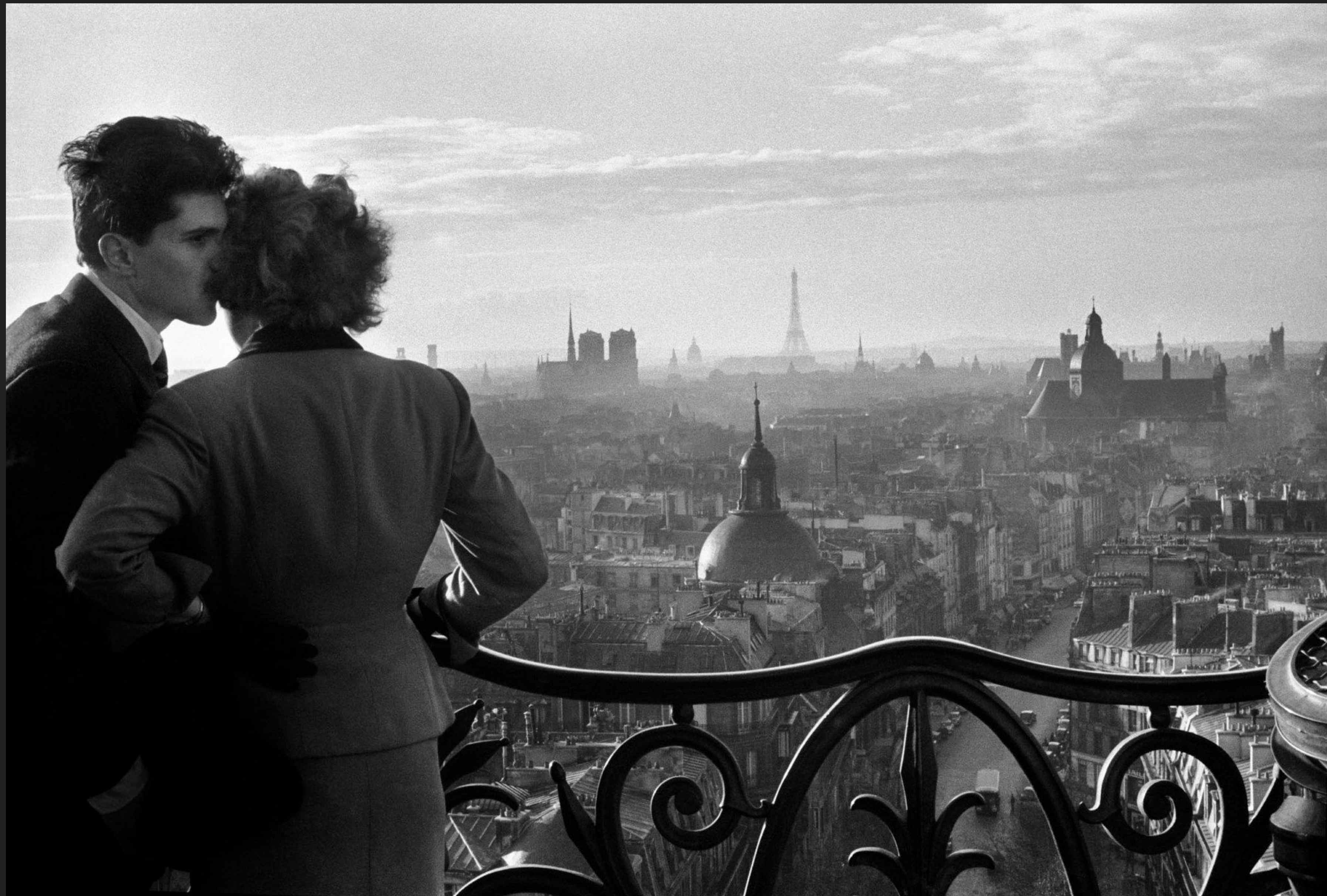
“Les Amoureux de la Bastille” , Willy Ronis Paris, 1957