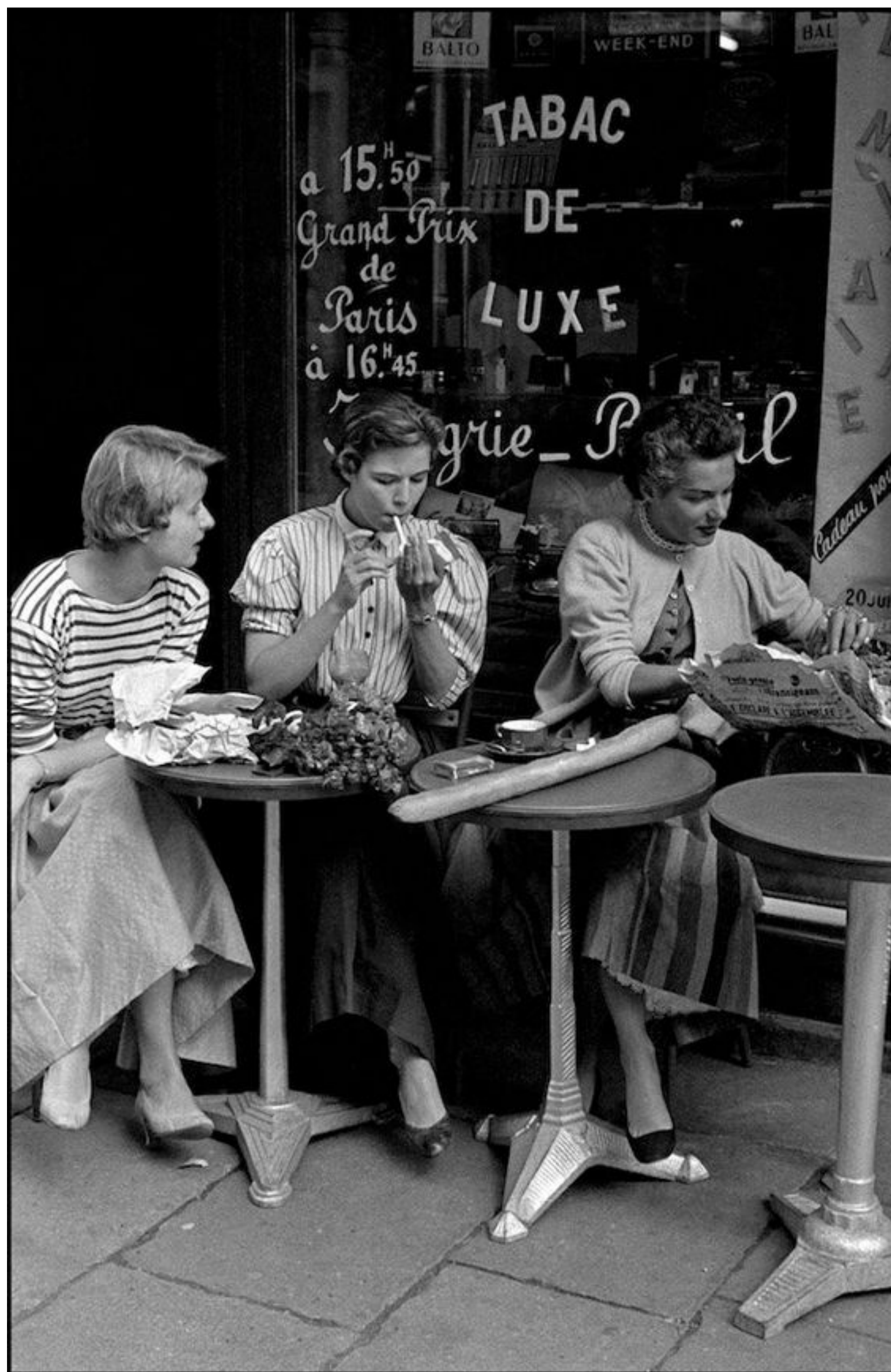
(Fotografia di Inge Morath, 1950 circa, Magnum Photos)