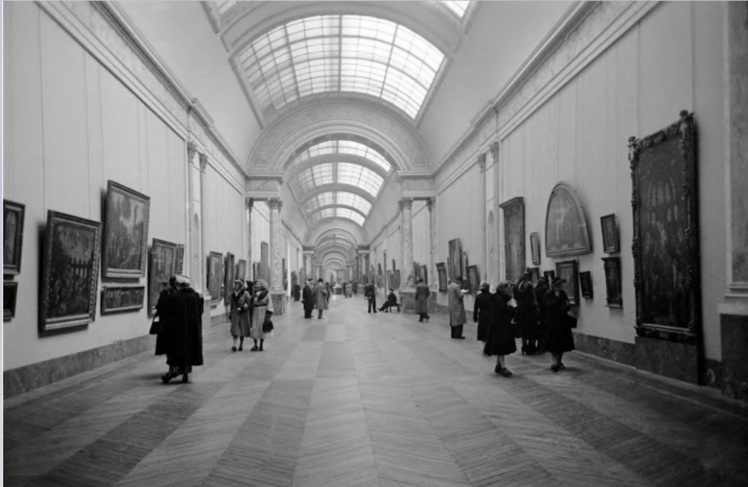
“The Louvre” Dmitri Kessel, 1950

Si può lasciare Parigi, ma non si dimentica mai.