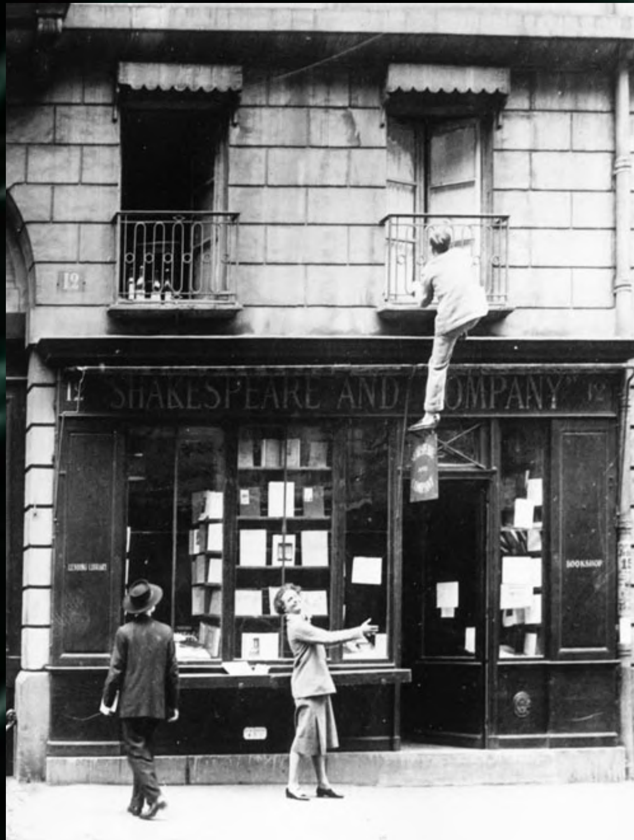
SILVYA BEACH CON IL COMPOSITORE AMERICANO GEORGE ANTHEIL CHE CERCA DI ARRAMPICARSI AL PRIMO PIANO DELLA SHAKESPEARE AND COMPANY INTORNO AL 1935