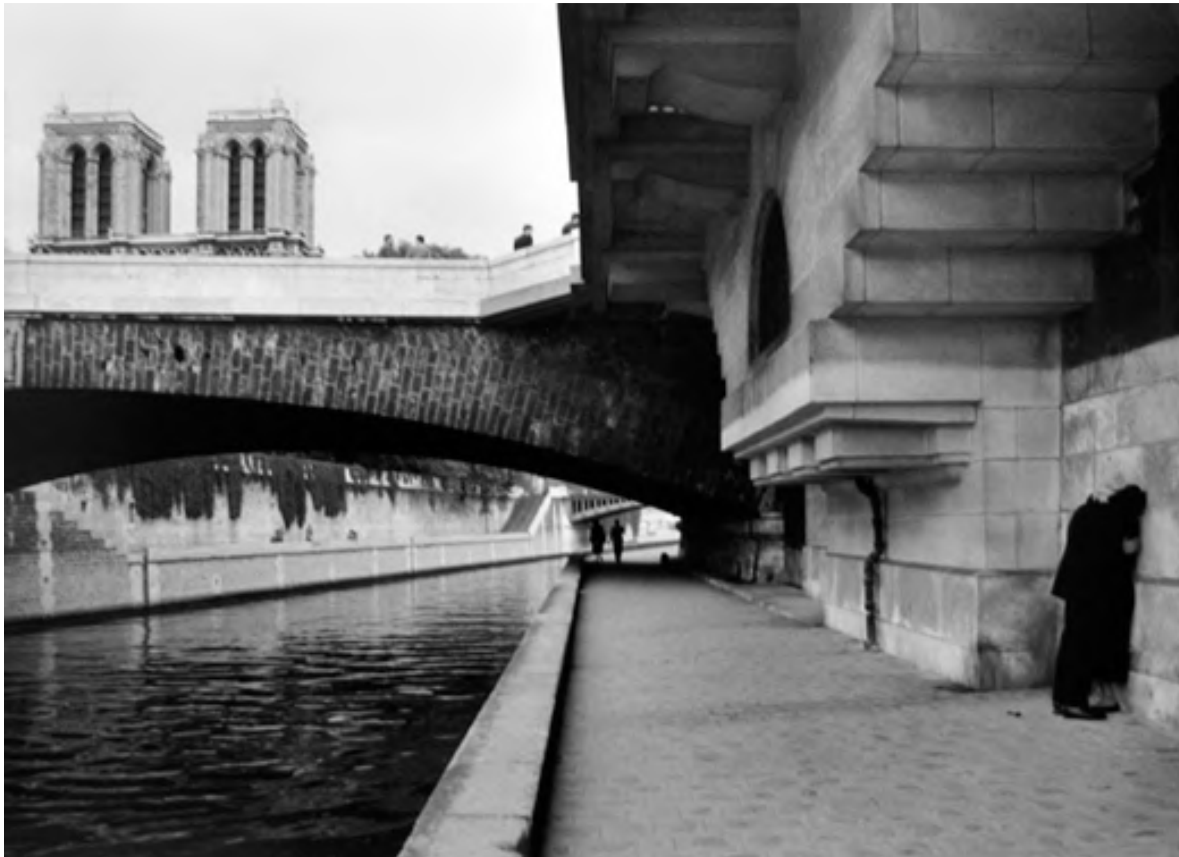
“Le Petit Pont” Willy Ronis Paris, 1957