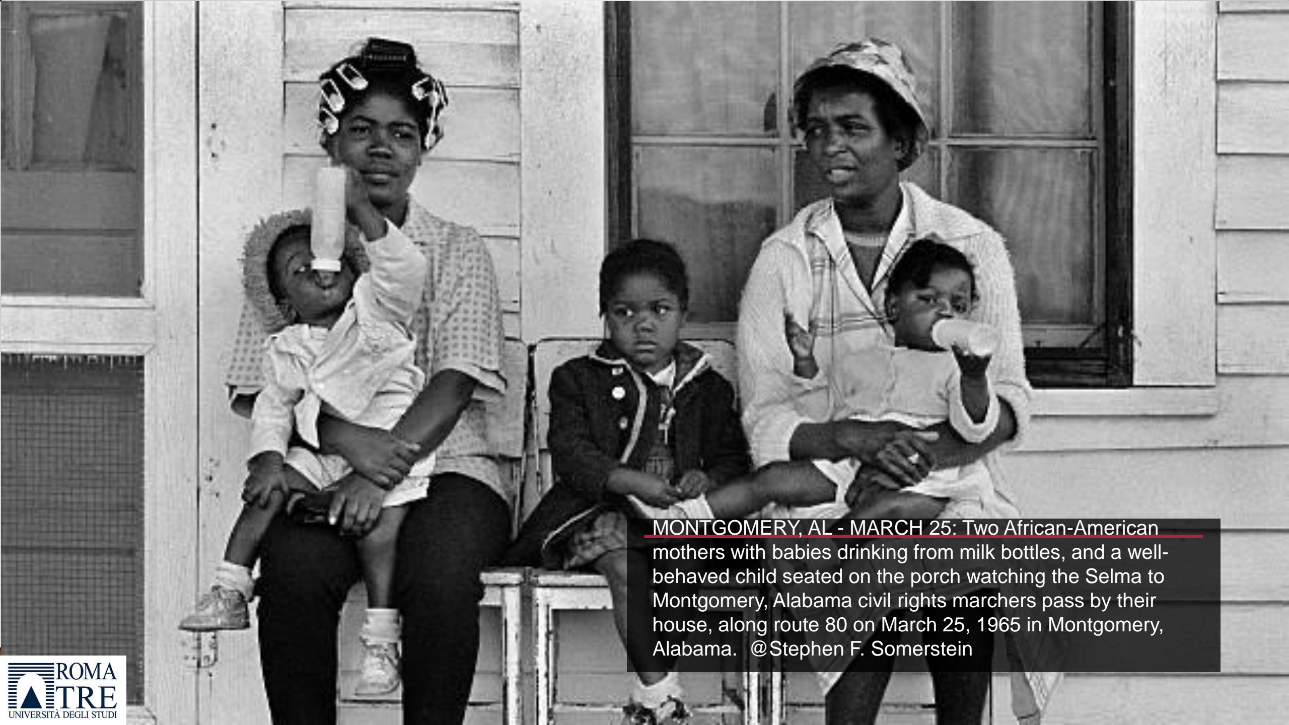
MONTGOMERY, AL - MARCH 25 : Two African-American mothers with babies drinking from milk bottles, and a well-behaved child seated on the porch watching the Selma to Montgomery, Alabama civil rights marchers pass by their house, along route 80 on March 25, 1965 in Montgomery, Alabama.