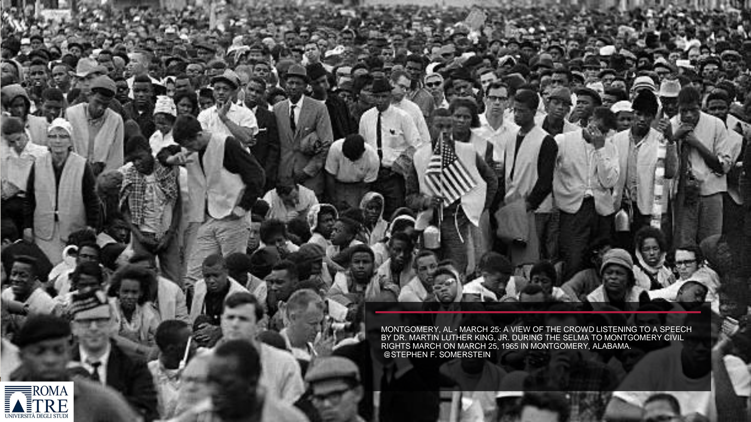
MONTGOMERY, AL - MARCH 25: A VIEW OF THE CROWD LISTENING TO A SPEECH BY DR. MARTIN LUTHER KING, JR. DURING THE SELMA TO MONTGOMERY CIVIL RIGHTS MARCH ON MARCH 25, 1965 IN MONTGOMERY, ALABAMA.