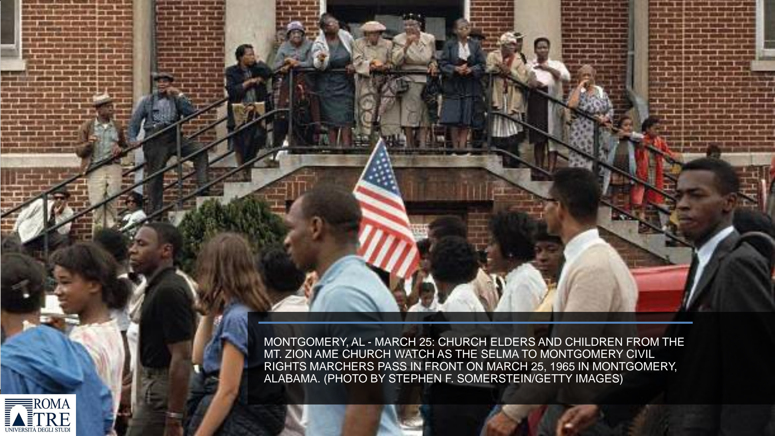
MONTGOMERY, AL - MARCH 25: CHURCH ELDERS AND CHILDREN FROM THE MT. ZION A.M.E. CHURCH WATCH AS THE SELMA TO MONTGOMERY CIVIL RIGHTS MARCHERS PASS IN FRONT ON MARCH 25, 1965 IN MONTGOMERY, ALABAMA.