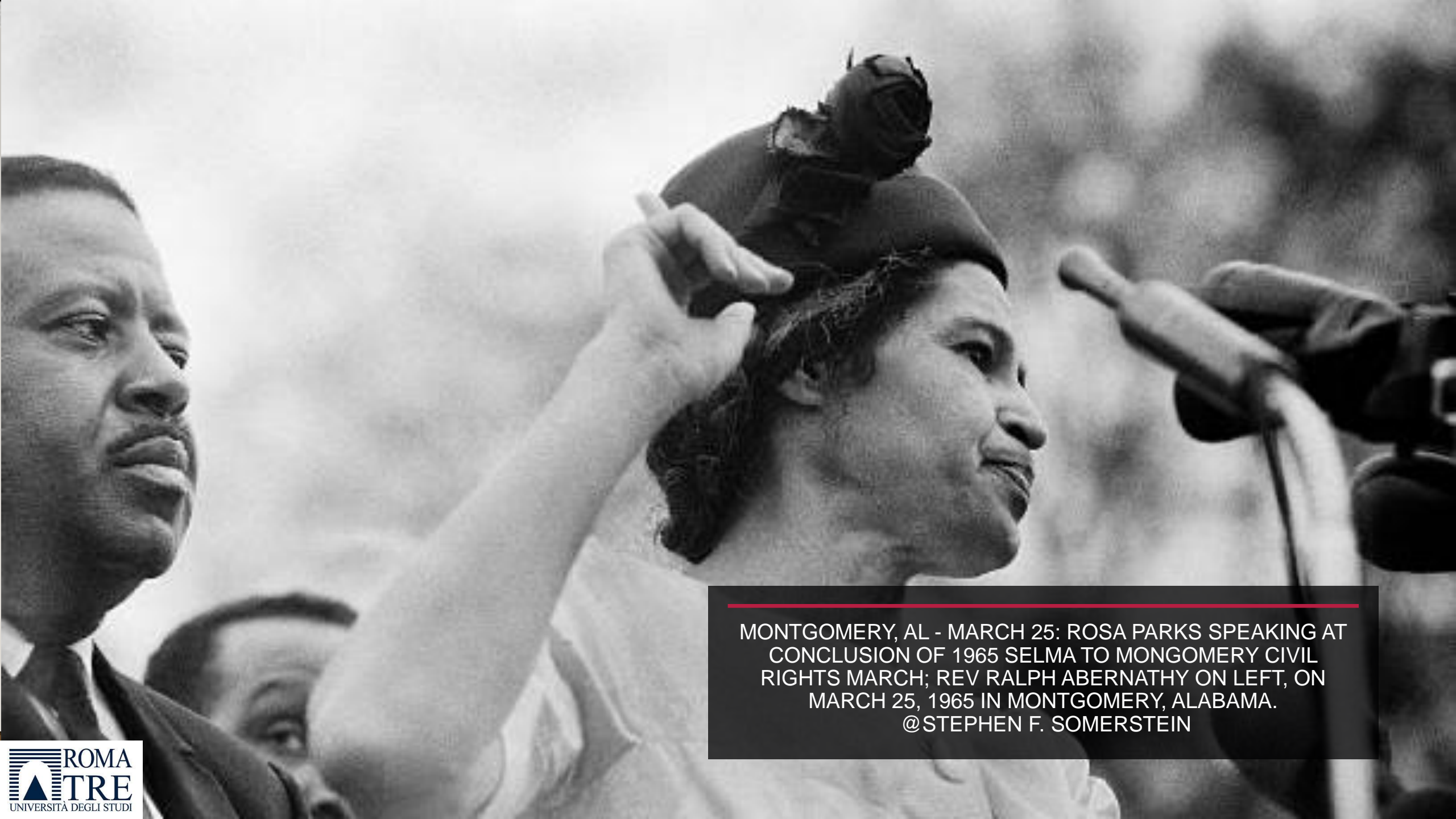
MONTGOMERY, AL - MARCH 25: ROSA PARKS SPEAKING AT CONCLUSION OF 1965 SELMA TO MONGOMERY CIVIL RIGHTS MARCH; REV RALPH ABERNATHY ON LEFT, ON MARCH 25, 1965 IN MONTGOMERY, ALABAMA.