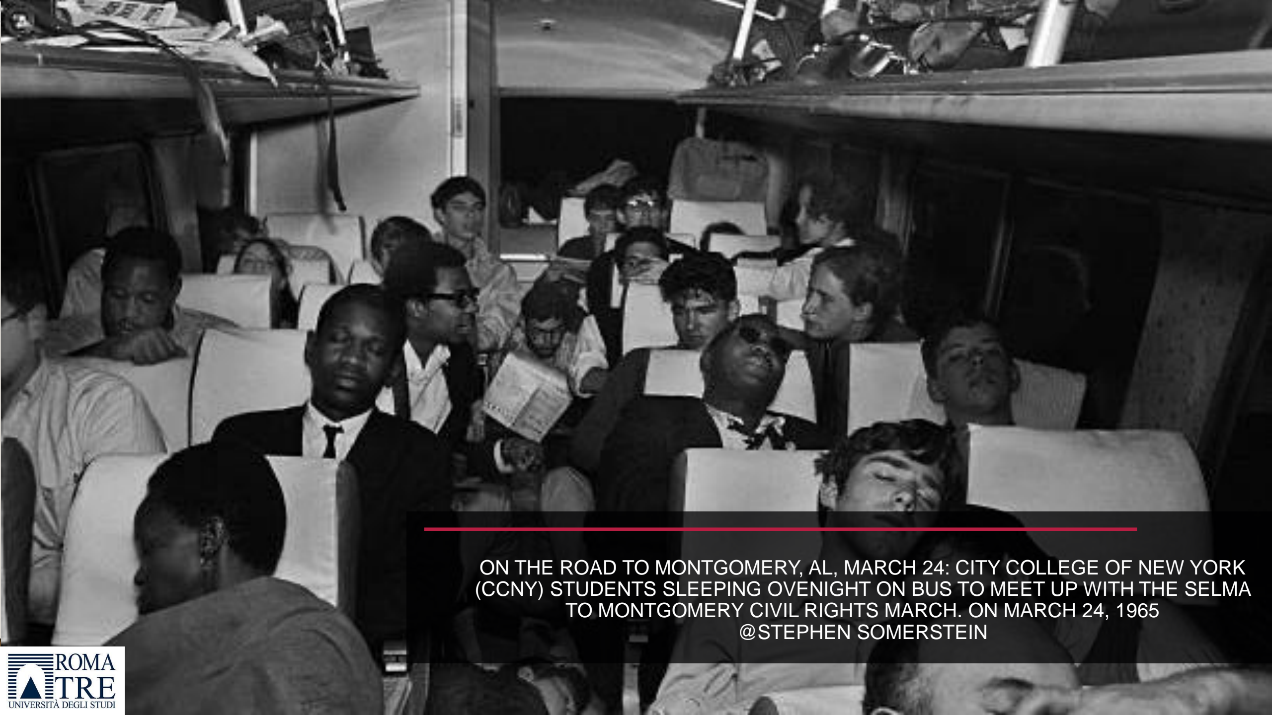
ON THE ROAD TO MONTGOMERY, AL, MARCH 24: CITY COLLEGE OF NEW YORK (CCNY) STUDENTS SLEEPING OVERNIGHT ON BUS TO MEET UP WITH THE SELMA TO MONTGOMERY CIVIL RIGHTS MARCH. ON MARCH 24, 1965