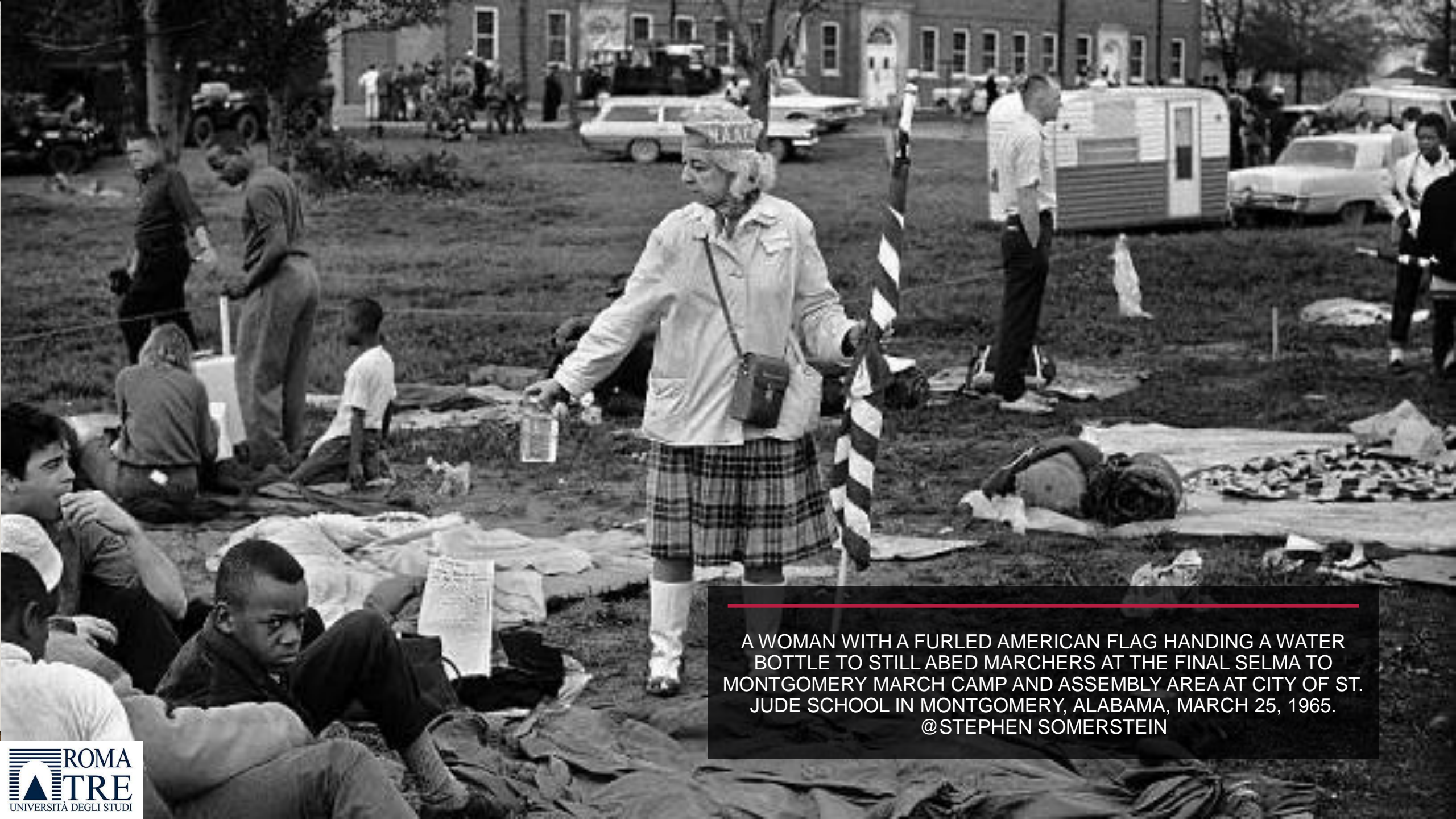
A WOMAN WITH A FURLED AMERICAN FLAG HANDING A WATER BOTTLE TO STILL ABED MARCHERS AT THE FINAL SELMA TO MONTGOMERY MARCH CAMP AND ASSEMBLY AREA AT CITY OF ST. JUDE SCHOOL IN MONTGOMERY, ALABAMA, MARCH 25, 1965.