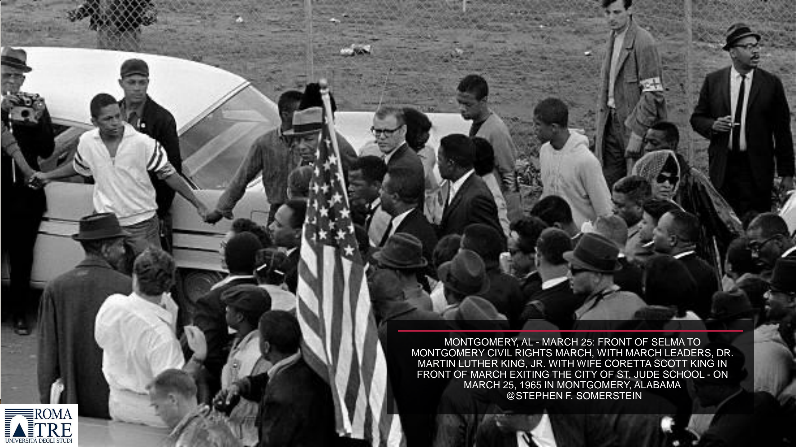
MONTGOMERY, AL - MARCH 25: FRONT OF SELMA TO MONTGOMERY CIVIL RIGHTS MARCH, WITH MARCH LEADERS, DR. MARTIN LUTHER KING, JR. WITH WIFE CORETTA SCOTT KING IN FRONT OF MARCH EXITING THE CITY OF ST. JUDE SCHOOL - ON MARCH 25, 1965 IN MONTGOMERY, ALABAMA