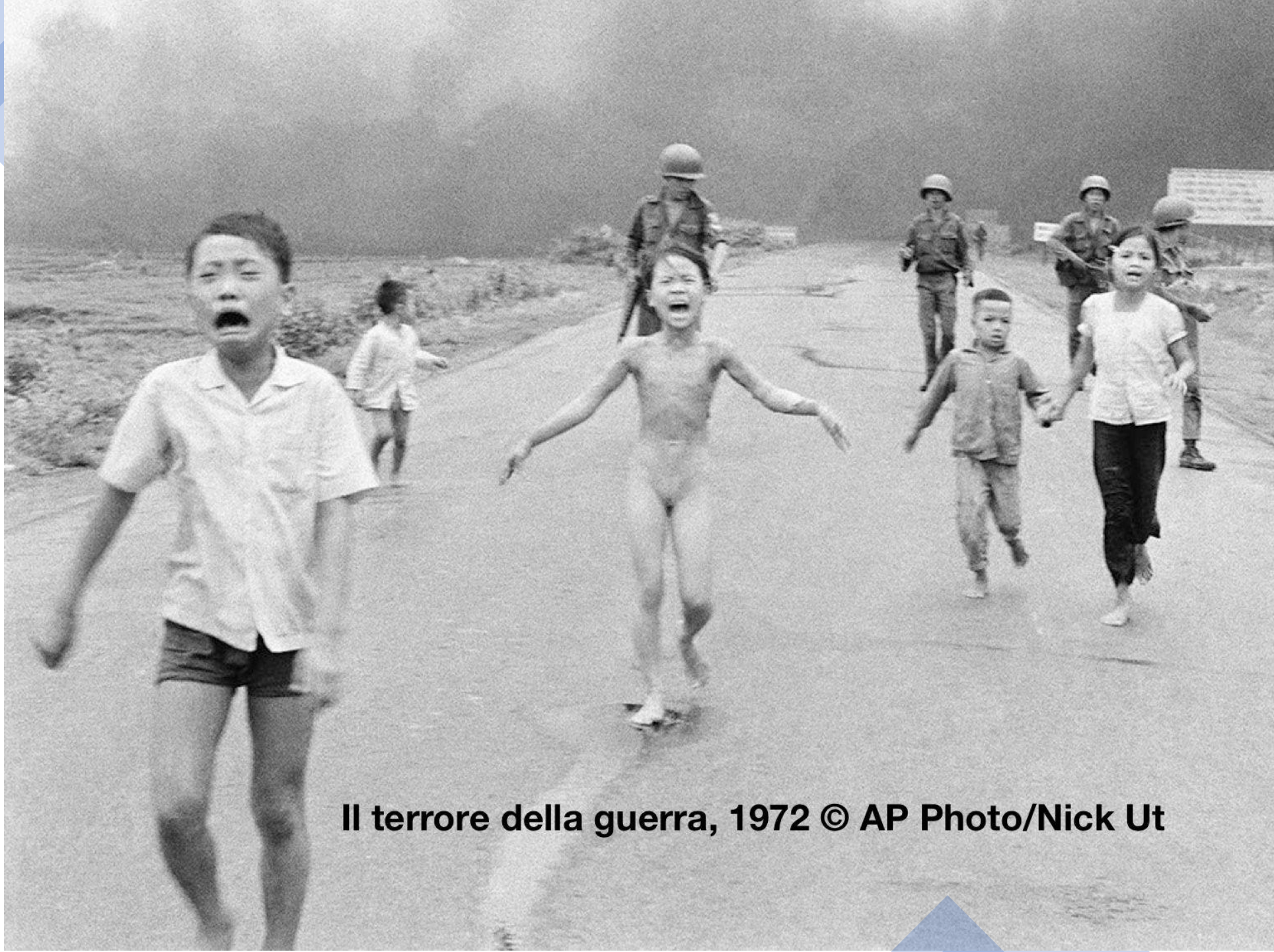
Il terrore della guerra, 1972