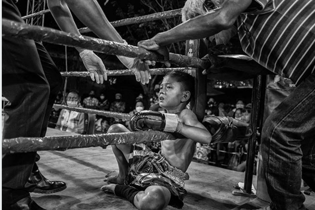
Lo sfinimento sul volto del bambino accovacciato all'angolo a fine incontro. Bangkok, Thailandia, 2020.