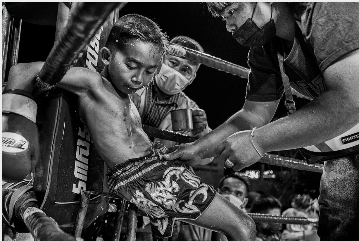
Bambino riposa e riceve indicazioni dal suo angolo tra un round di combattimento e l'altro. Bangkok, Thailandia, 2020.