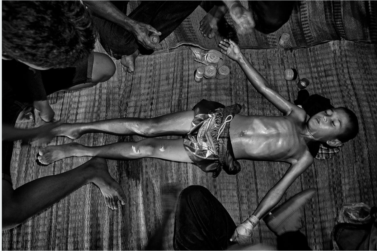
Bambino viene cosparso di olii e creme prima del combattimento. Bangkok, Thailandia, 2020.