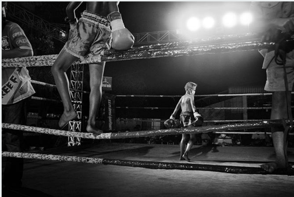
Bambino scavalca le corde per accedere al ring. Sullo sfondo l'altro bambino suo avversario. Bangkok, Thailandia, 2020. Alain Schroeder/Muay Thai Kids