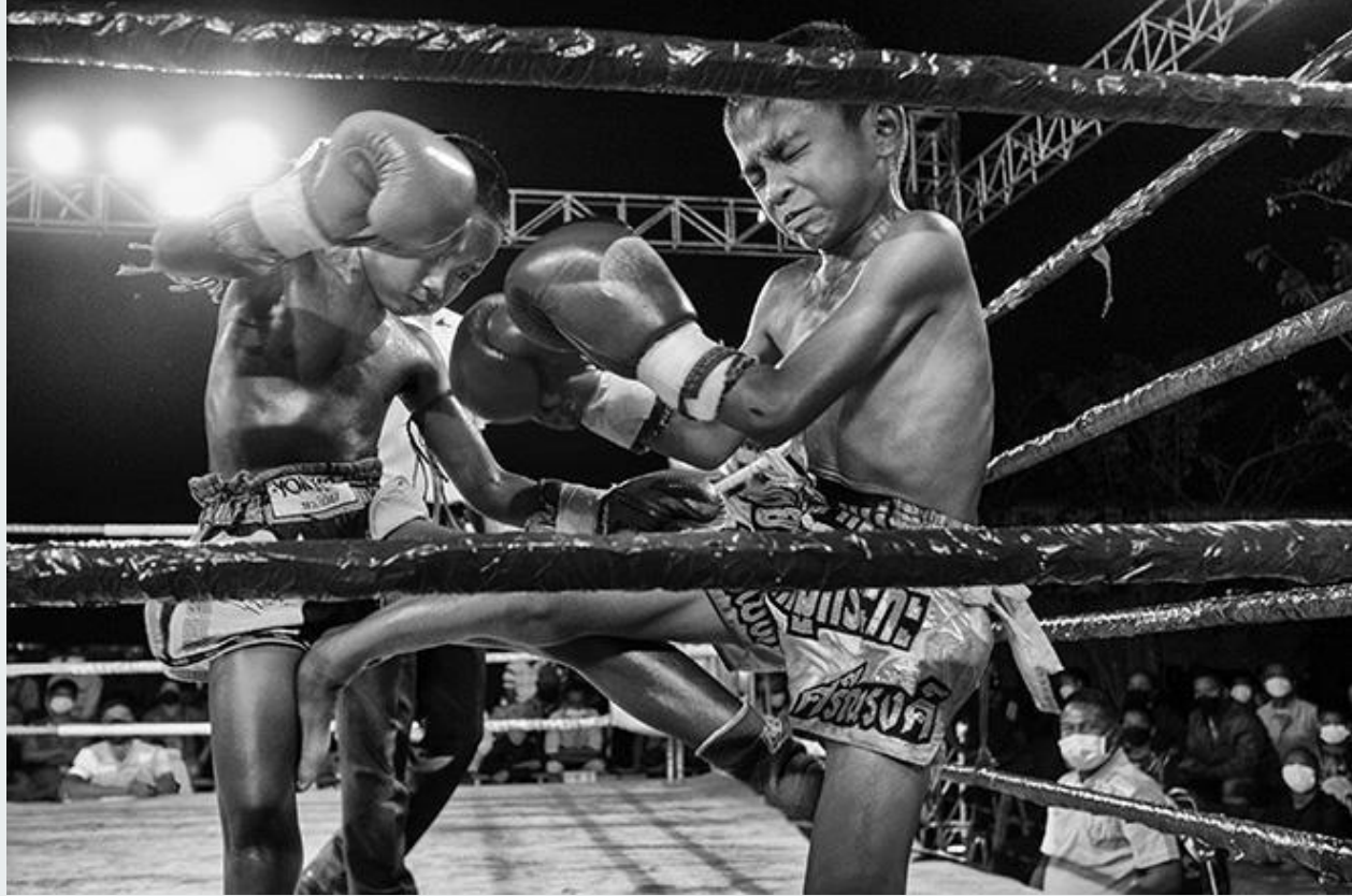
Scambio di colpi tra bambini che combattono sul ring. Bangkok, Thailandia, 2020.