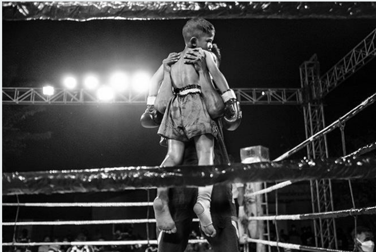
Allenatore solleva tra le braccia il suo allievo per celebrare la vittoria. Bangkok, Thailandia, 2020.