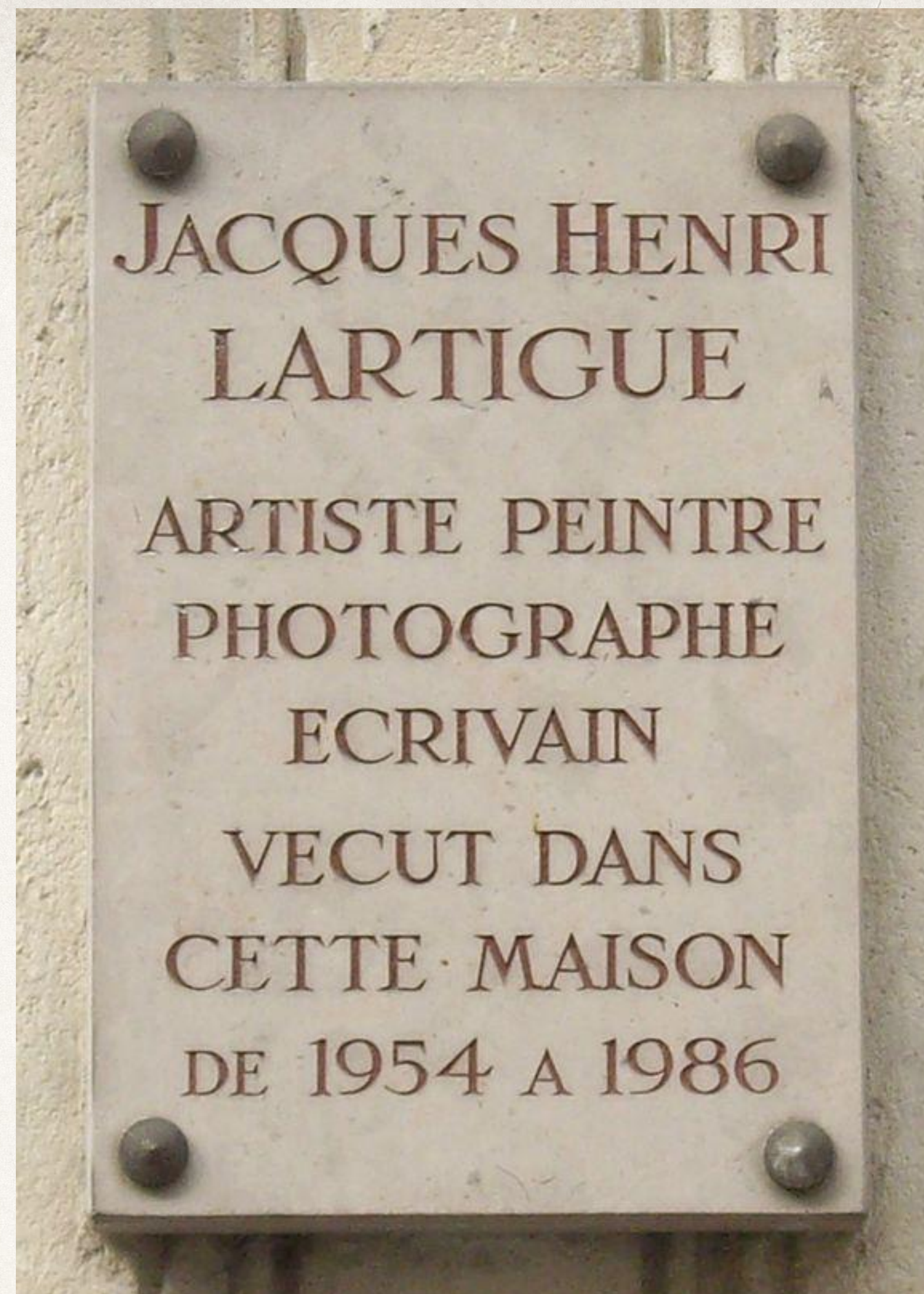
Lapide commemorativa al no 102 di Rue de Longchamp, dove Lartigue visse dal 1954 al 1986